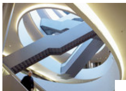
Innenstudie von Sihlcity bei der Autobahnausfahrt Zürich-Brunau.